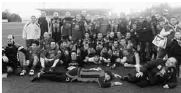
IL FOLTO GRUPPO DI PARTECIPANTI DEL MATCH ORGANIZZATO DAL FAN CLUB TROINA