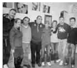
I VOLONTARI CON DUE OSPITI

Troina. Progetti di volontariato per giovani, persone diversamente abili e un «mini golf» per gli studenti